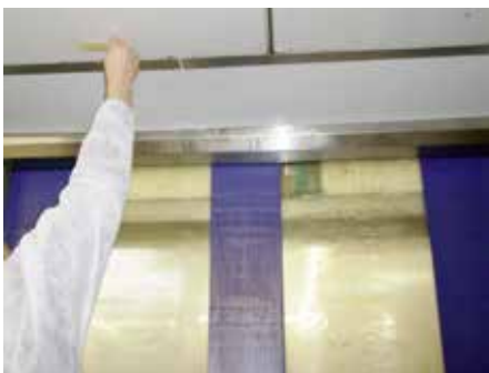
Hygienische Kontrolle der Decke im Kühlraum/Reiferaum (Kondensattropfen als Kontaminationsrisiko)

Die Optimierung des Luftmanagement ist z. B. durch Einbringung von ausreichend gefilterter Luft und homogener Luftdurchspülung im Raum stufenweise leicht umzusetzen. Dadurch wird auch der Eintrag von ungewünschter Mikrobiologie von außen größtmöglich verhindert. Mittels strömungsunterstützender Anbringung der Zuluftausstritte im Raum, wie ggf. ergänzend durch Transportlüfter, wird saubere, konditionierte