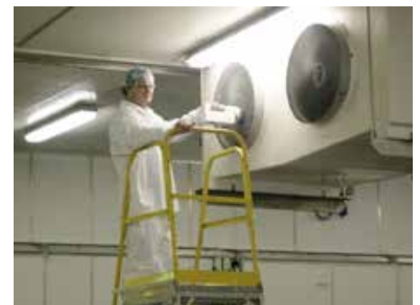
Erfassung der Keimbelastung aus/in den Umluftkühlern

Die überwiegende Zahl Bakterien hat die Form von Stäbchen, die nicht mehr als 1 µm breit und 5 µm lang sind. Viele Pseudomona-