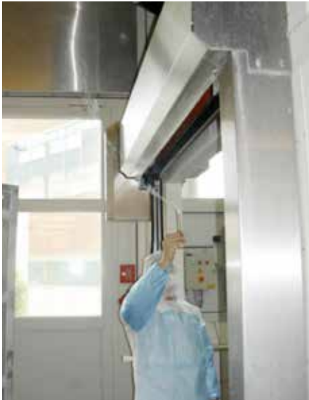
Visualisierung der Luftströmungsverläufe

Richtwert der Druckverhältnisse) für jeden Bereich/Raum in der Prozesskette. Diese wichtigen Informationsgrunddaten, stellen den Hygiene - klimatischen Ist-Zustand dar. Anhand der so analysierten Prozessabläufe ergeben sich sehr schnell Hinweise, ob und wie innere Lasten entstehen, aber auch wie sich Kontaminationsrisiken daraus vermeiden lassen. Nach systematischer Erfassung und transparenter Darstellung der Hygiene - klimatischen Ist-Zustände, lassen sich anhand der Qualitätskennzahlen des Betriebes (z. B. hygienische-, wie klimatische- Grenzwerte, MHD, etc.) leicht die Soll-Zustände definieren und das Prozessumfeld daraufhin abstimmen.