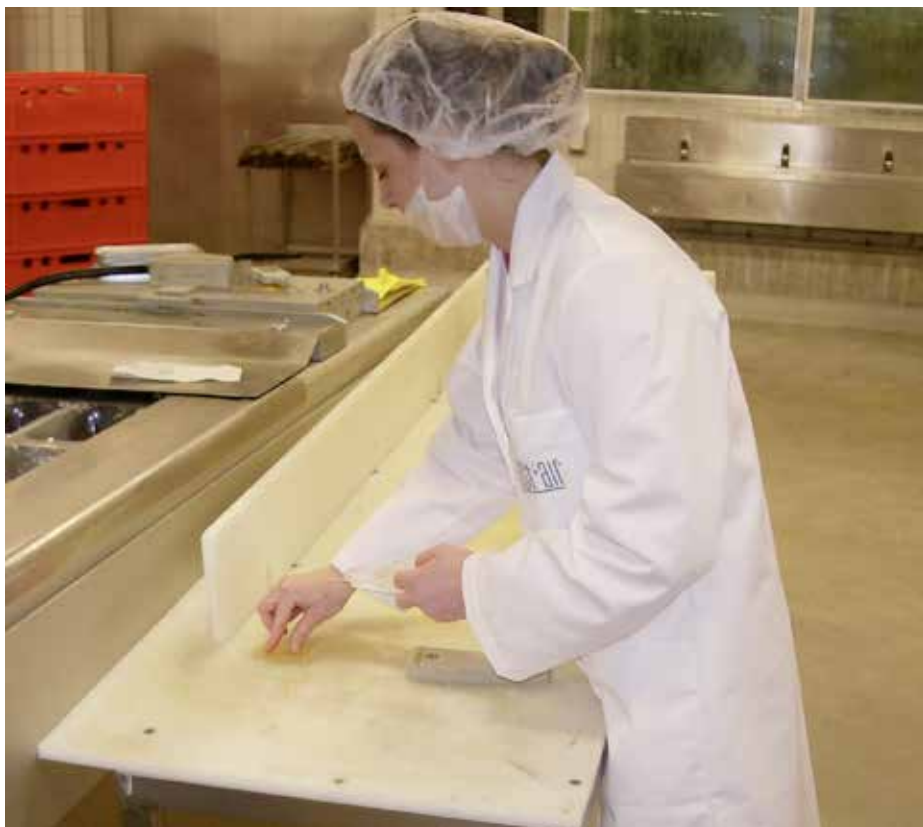
Hygienische Kontrolle der Arbeitsoberflächen

Technisch leicht zu ermitteln ist anhand der Unterlagen, wie durch eine systematische Begehung, das bestehende Luftmanagement der Lüftungs-/Klimatechnik, woraus sich die möglichen Optimierungen sicher ableiten lassen. Ein weiterer Schritt, ist die Berechnung der Luftbilanz (zu- und Abluft als